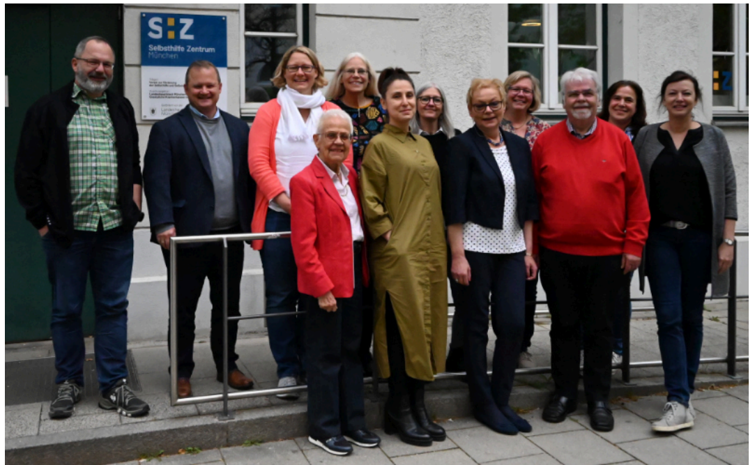
Teilnehmer*innen der Vergabesitzung Runder Tisch Region München 2024 vor dem SHZ

413 Selbsthilfegruppen aus den Bereichen Behinderung, Sucht, chronische und psychische Erkrankungen werden finanziell mit rund 1.101.458 € unterstützt. Das sind 17 Gruppen mehr als in 2023 und rund 79.930 € an Zuwachs bei den Fördermitteln.