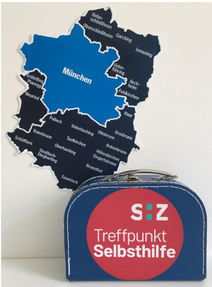
Der Landkreis München im Fokus

Bei allen Kontakten ging es stets um die zentralen Aspekte: Definition, Wert und Wirkung der Selbsthilfe und die möglichen Leistungen des SHZ erklären sowie gemeinsam mit den Kooperationspartnern anzudenken, wie die Selbsthilfe vor Ort unterstützt werden kann. Ganz häufig zeigt sich dabei: Der entscheidende Schritt ist schon dadurch getan, dass die Kolleg*innen vor Ort über Selbsthilfe und das SHZ konkret Bescheid wissen und in ihrer alltäglichen Arbeit auf uns verweisen können. Denn, was man selbst kennt, kann man besser empfehlen und hilft so manchen Ratsuchenden offenbar über die erste Hemmschwelle hinweg.